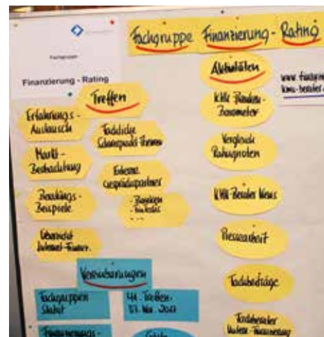
Präsentation der Fachgruppe Finanzierung-Rating auf der Herbstfachtagung 2017

Die Fachgruppen sind autonom und geben sich nach den Grundsätzen des Verbandes ein eigenes Statut. Sie bestimmen selbst ihre Anforderungen an Mitglieder zur Aufnahme in die Fachgruppe. Jedes Mitglied in der Fachgruppe weiß, dass diese nur funktioniert auf der Basis von gegenseitigem Geben und Nehmen.